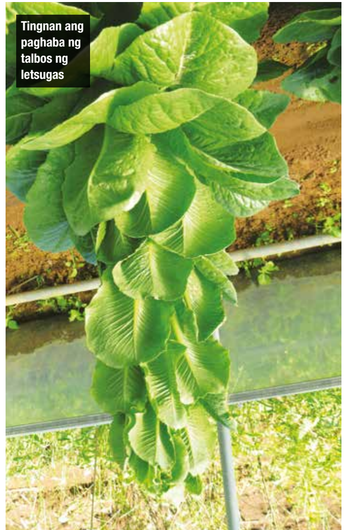
Nag-bolting na letsugas

Matapos ang anihan, bunutin ang mga puno at araruhin agad ang lupa upang mapatay at mapangalagaang kumalat pa ang mga peste at sakit sa ibang pananim. Ito ay napakahalagang alituntunin.