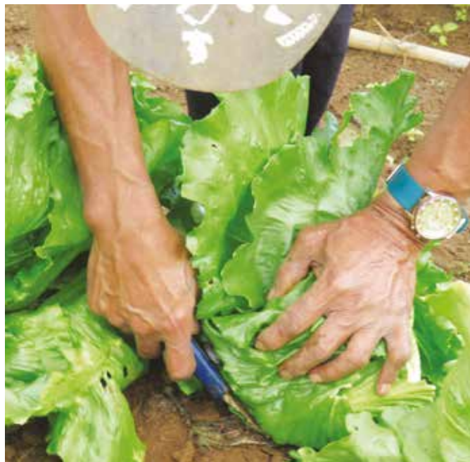
Sa pag-aani ng letsugas, putulin sa puno gamit ang matalas na kutsilyo