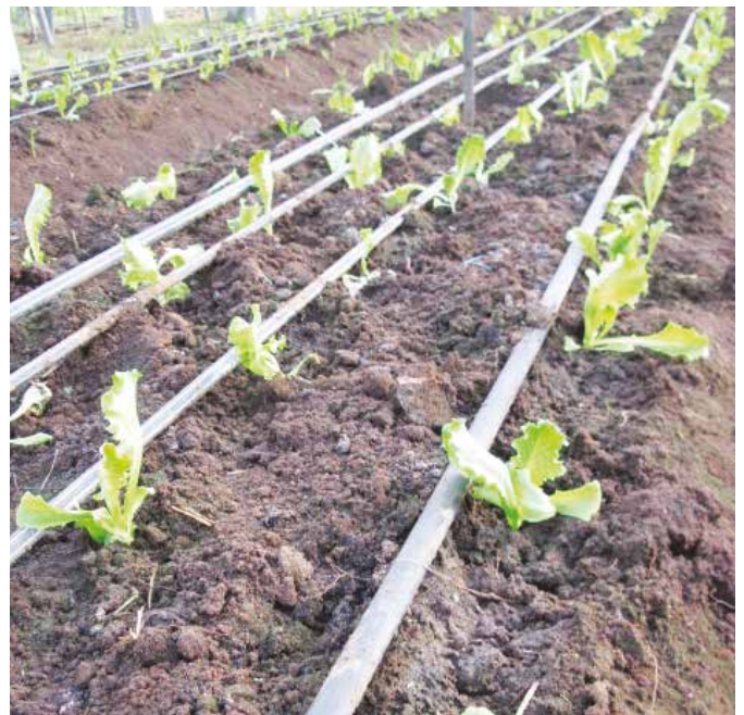
Bagong lipat-tanim na letsugas.

Kilib: Ang kagkilib na ginawa sa Claveria ay nagpapatunay na tumaas ang ani ng 8-14% kumpara sa walang kilib. Pinakamagandang gamit na pangkilib ay dayami o tangkay ng mais. Ang ipa at dahon ng kakawate ay puede ring gamitin. Ilatag ang kilib na may kapal na 2.5 pulgada sa ibabaw ng kama 1 linggo bago maglipat-tanim upang mapanatiling basa-basa ang lupa at di tubuan ng damo.