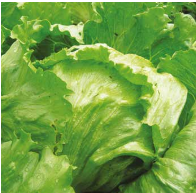
Tamang edad ng letsugas para anihin