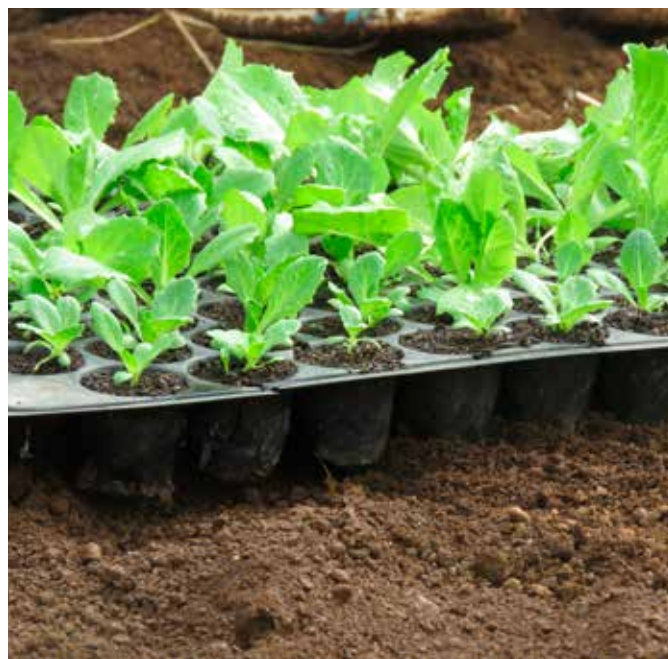
Pananim na punla ng letsugas

Sa umaga ang pinaka-mainam na oras ng pag-aani na kung kailan malamig at siksik ang ulo ng letsugas. Anihin ang letsugas bago pa ito mag bolting . Di kaiga-igaya ang bolting kung kailan ay humahaba ang talbos ng letsugas at mapait na lasa.