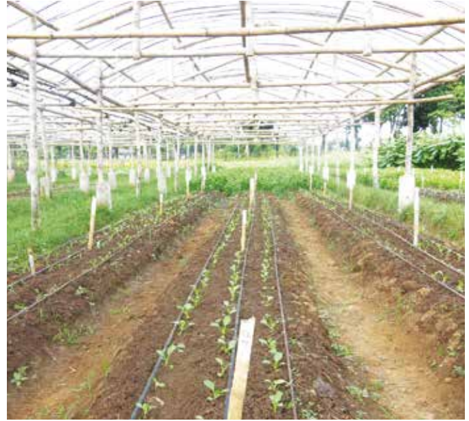
Bagong lipat-tanim na petsay sa ilalim ng house-type structure