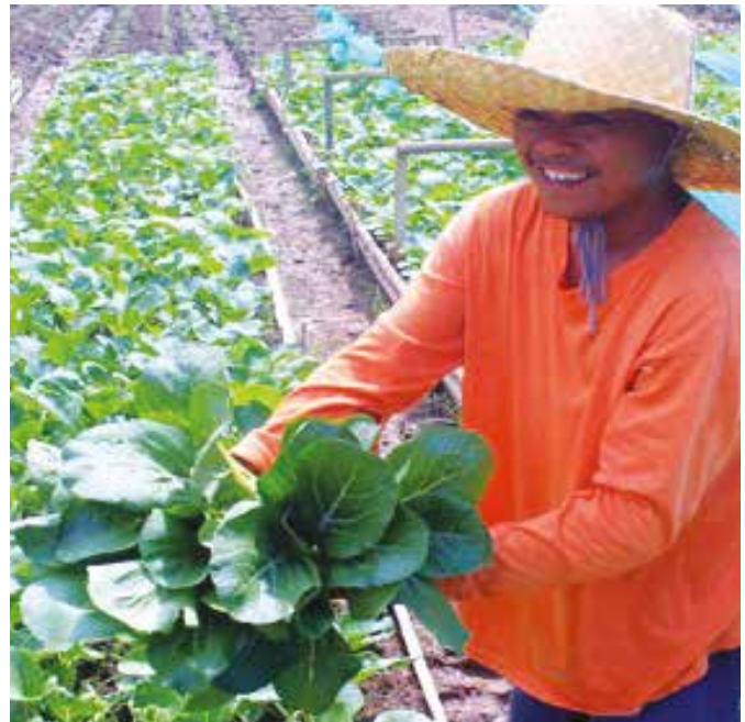
Mainam na pa-aani ng petsay ay sa hapon.