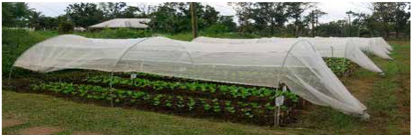
Pechay sa ilalim ng low tunnel na may takip na kulambo