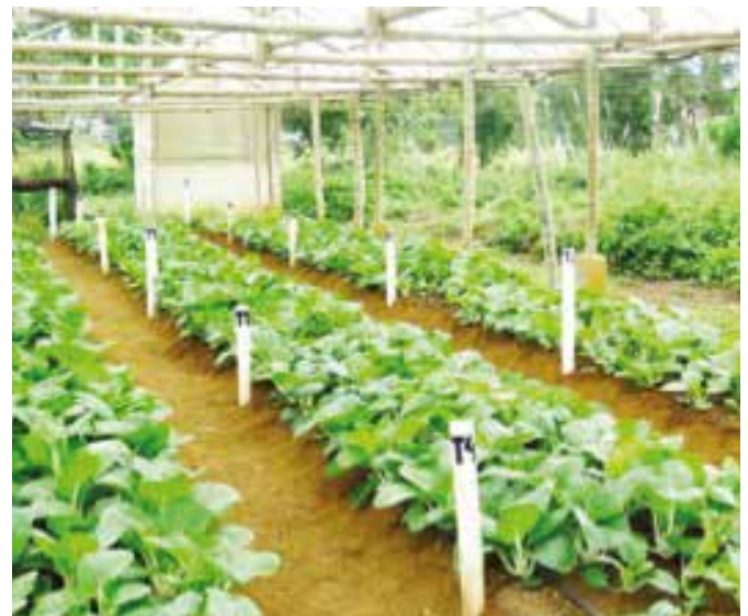
Pechay sa ilalim ng house-type protected structure .

Ang pinakamagandang struktura para sa petsay ng Eastern Visayas ay house-type rain shelter na may takip na UV-stabilized plastik at low-tunnel na may takip na kulambo para lagusan ang init ng araw at mabawasan ang tama ng malakas na ulan. Sa protected cropping puedeng magtanim ng petsay sa buong taon.