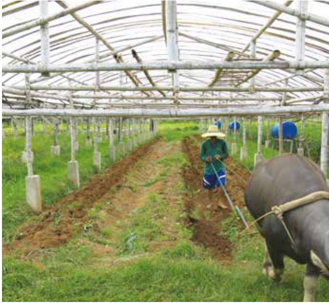
Pag-aararo ng tataniman ng petsay