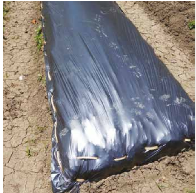
Plastic mulch ready to cut planting holes.

Organikong kilib. Sa halip na plastik, puwedeng latagan ng 2.5 pulgadang kapal na mga dahon ng hagonoy ( Chromolaena odorata , na magaling din para sa pagpuksa ng mga sakit ng halaman), dayami, ipa at dahon ng kakawate upang mapanatiling masa-masa ang lupa at di tubuan ng damo.