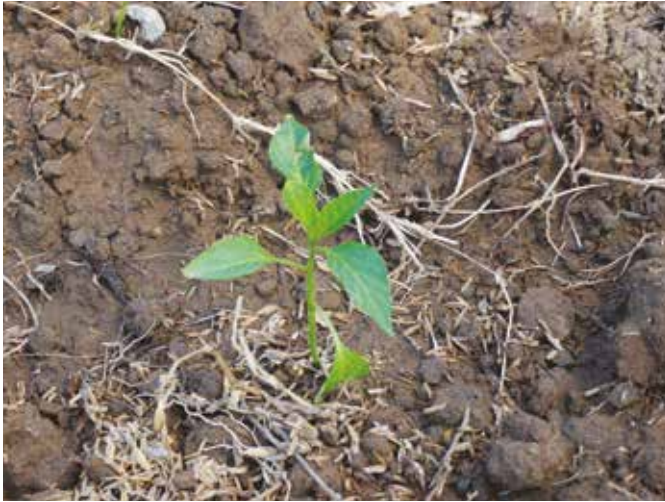
Bagong lipat-tanim na sweet pepper.