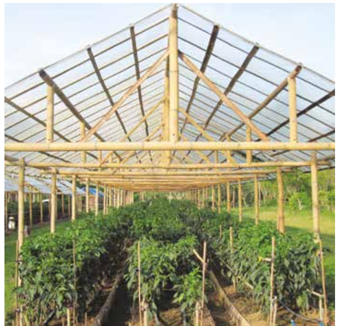
House-type para sa sweet-pepper

Hawanin at alisan ng damo at araruhin ang lupang pagtataniman. Uliting ang pag-aararo at paggayat