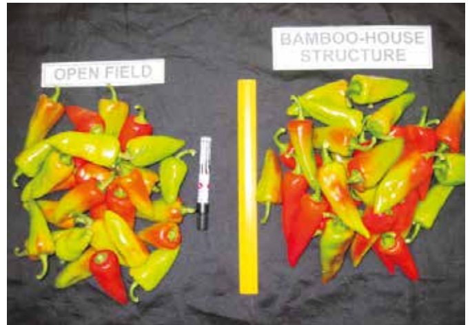
Bunga ng sweet pepper sa linang Bunga ng sweet pepper sa hose-type structure